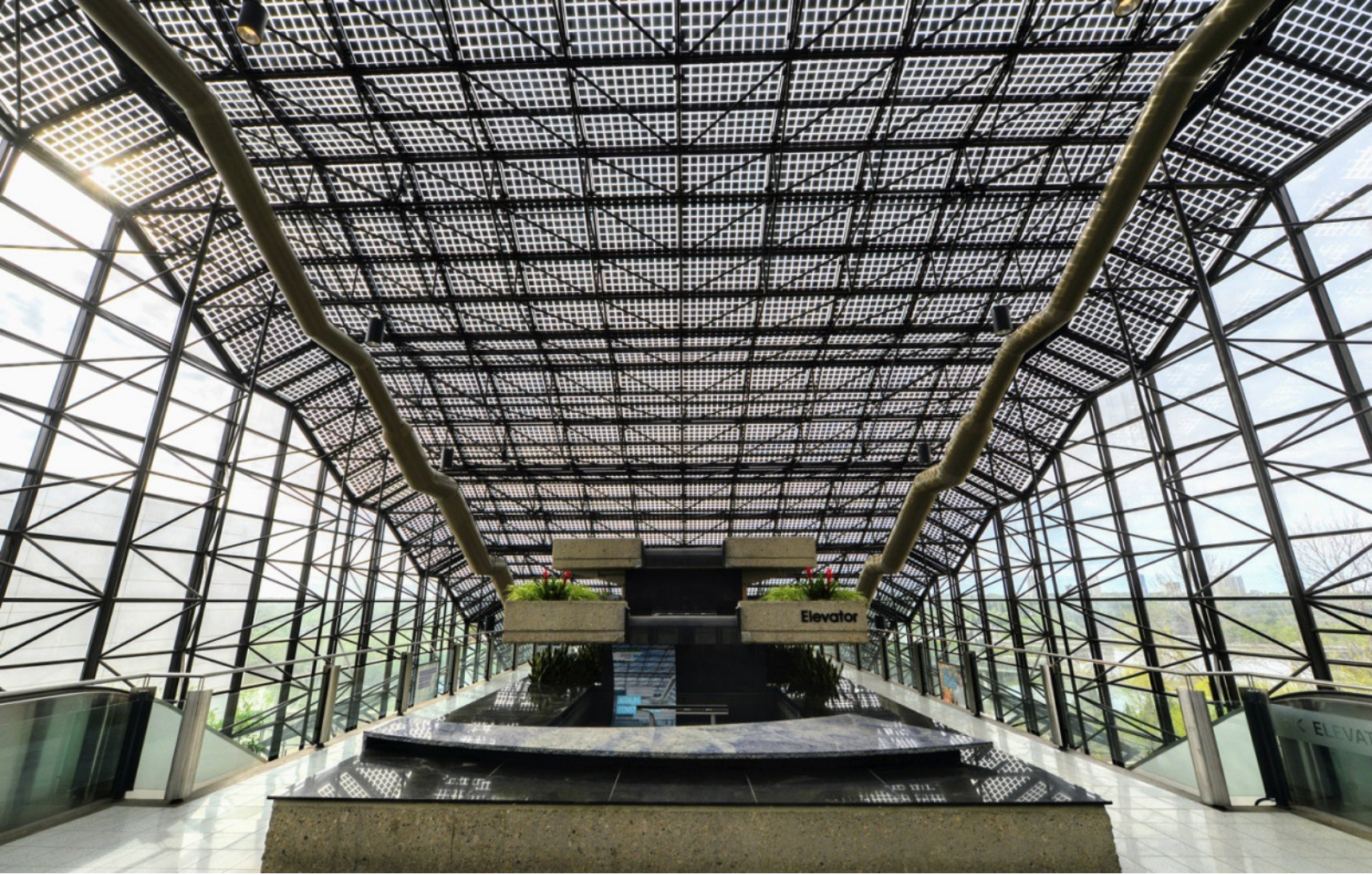
Edmonton Convention Centre